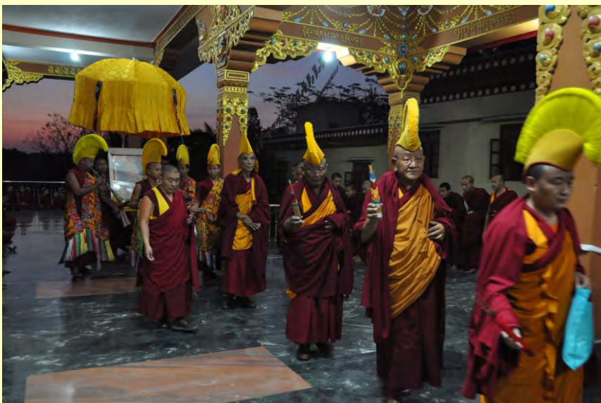
Foto links: tijdens de openingsceremonie wordt het portret van zijne heiligheid de Dalai Lama naar diens troon begeleid.