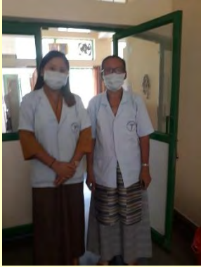
Een verpleegster en arts

De medische kliniek is gelegen te midden van de Tibetaanse nederzetting in Mundgod India aan de rand van het Ganden klooster. In de kliniek zijn zowel dorpelingen als kloosterlingen welkom. Indien een meer gespecialiseerde behandeling nodig is, worden mensen doorverwezen naar een groter ziekenhuis in Hubli of Bangalore. De behandeling in een gespecialiseerd ziekenhuis wordt voor 50% bekostigd uit het Zieke monniken fonds.