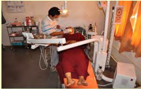
Ook kundige tandheelkundige zorg wordt verleend

Geshela en een paar vrienden van Stichting Dhonden zijn in december naar het klooster geweest (zie ook het activiteitenverslag). Zij waren zeer onder de indruk van de kliniek: de werkwijze is zeer professioneel en modern en grote aantallen mensen worden ondersteund. Vanwege de ziekte van één van hen moesten ze er zelf ook gebruik van maken, ze werden zeer vriendelijk en adequaat geholpen.