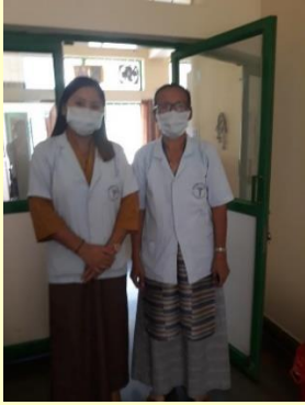
Een verpleegster en arts