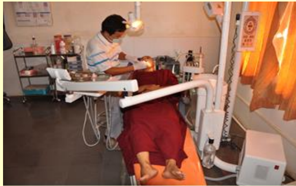
Ook kundige tandheelkundige zorg wordt verleend