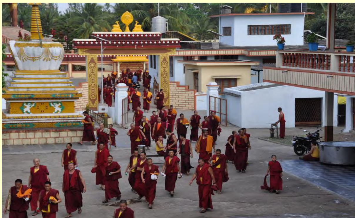
Monniken die na de lessen teruggaan naar hun woningen

Stichting Dhonden zet zich in voor het behoud van de Tibetaans Boeddhistische cultuur in de kloosters in India en in het bijzonder het Ganden Jangtse klooster, het klooster waar Geshe Sonam Gyaltzen aan verbonden is. Hulp wordt op meerdere vlakken verleend als studiematerialen, levensonderhoud, onderdak en gezondheidszorg. Door het goed functioneren van het ziekenhuis profiteert daarnaast de gevluchte Tibetaanse bevolking in de nederzettingen van de tegen lage kosten verleende zorg.