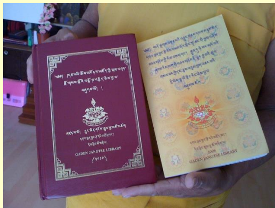
Waardevolle teksten gedrukt door GJ Bibliotheek

Met het bijdragen aan de genoemde basisvoorzieningen kunnen de monniken de Tibetaanse traditie en cultuur in stand houden.