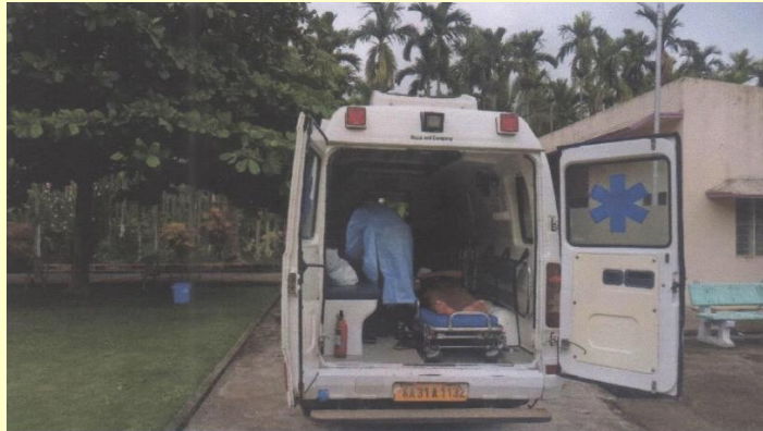
Ambulance voor spoedeisende zorg

het ziekenhuis in het Ganden Jangtse klooster biedt cruciale ondersteuning aan de grotendeels arme Tibetaanse patiënten. De kliniek is doorontwikkeld tot een klein ziekenhuis dat diverse medische hulp biedt: vaccinaties, medicijnen, tandarts, kleine operaties als staaroperaties, gezondheidseducatie etc. In het ziekenhuis zijn zowel dorpelingen als kloosterlingen welkom, tegen lage kosten voor de Tibetaanse bevolking en gratis voor monniken en nonnen en de armste leken.